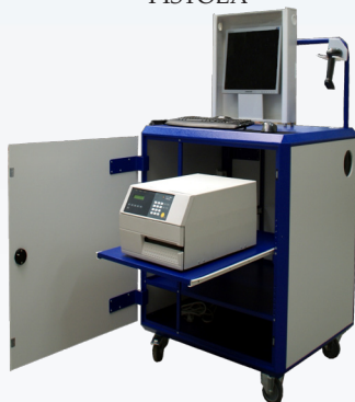
Armadio con stampante su ripiano estraibile e SUPPORTO PISTOLA