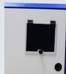
Uscita TAVL 24