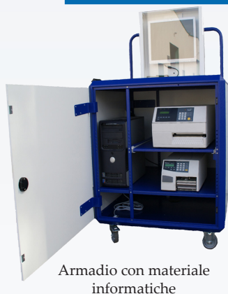
Armadio con materiale informatiche