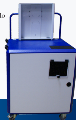
Armadio con portello TAV L24

Esiste versione Grande Freddo con sistema di riscaldamento